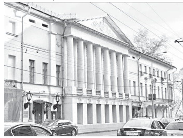
Здание Поливановской гимназии.