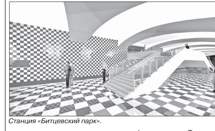
Станция «Битцевский парк».

Первая новая станция «Лесопарковая» будет возведена в районе 35-го километра МКАД, параллельно автодороге, рядом с техцентром «Варшавский». У нее два подземных вестибюля, в одном из которых предусмотрены пассажирские лифты